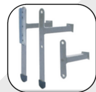
Wsporniki podłokietników z lub bez ślizgaczy