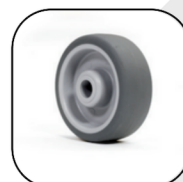
Kółka do parkietu